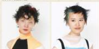
最優秀ジャパンカップ賞